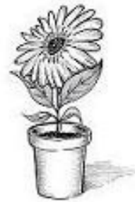
BLOOM = FLOWERMARKET